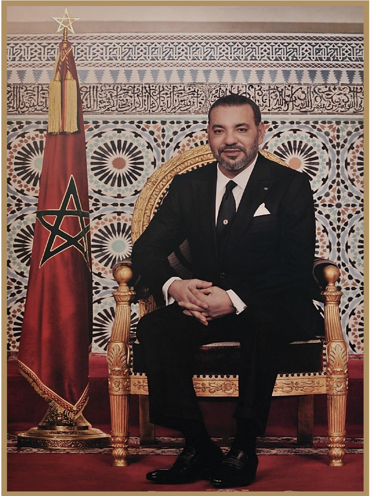
صاحب الجلالة الملك محمد السادس نصره الله وأيده